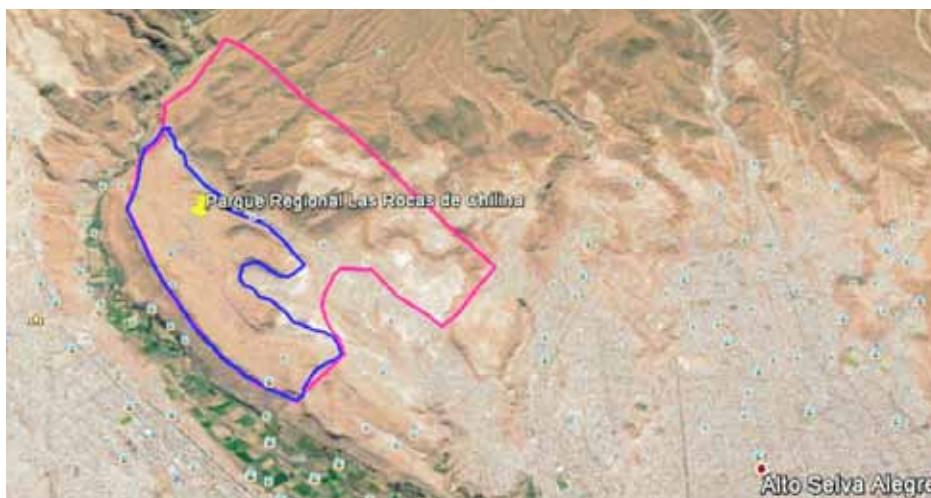
Ilustración 4. Delimitación del parque Las Rocas de Chilina en el distrito Alto Selva Alegre a partir del mapa de Google Earth.

A continuación se puede observar un mapa del distrito Alto Selva Alegre donde se aprecia el parque Las Rocas de Chilina, en la línea fucsia se encuentra el área de 510 ha que ocupaba el parque en 2004; mientras que, en la línea azul, se observan las 225 ha que ocupa el área del parque en la actualidad, según lo dispuesto por la Superintendencia Nacional de Bienes Estatales (SNB) en 2014.